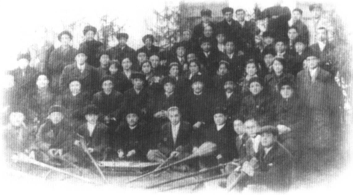
1937 - يىل سانايىنە پىسە ئەزالىرى