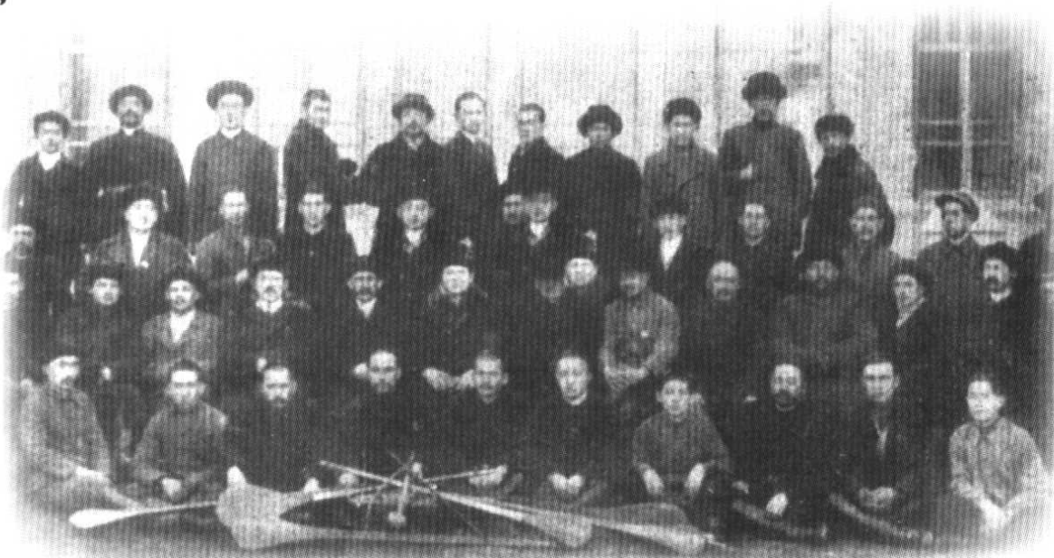
ئۆتكەن ئەسرنىڭ بېشىدا ئىلىدا ئۆتكەن بىر قىسىم چالغۇچىلار