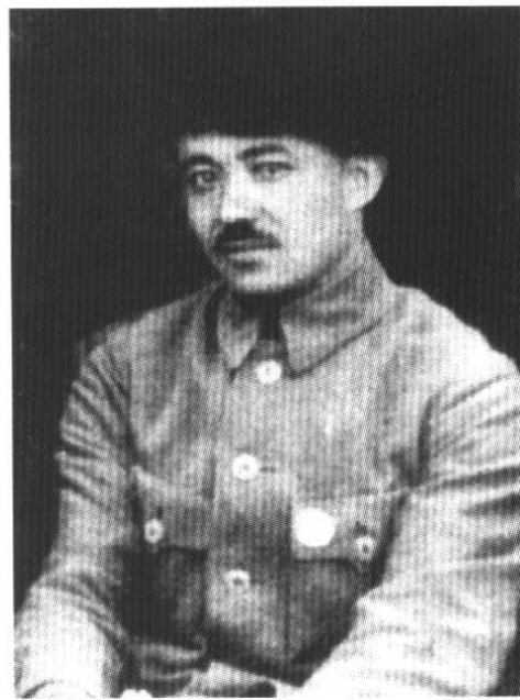
قاسمجان قەبىرى 30 – يىللاردا