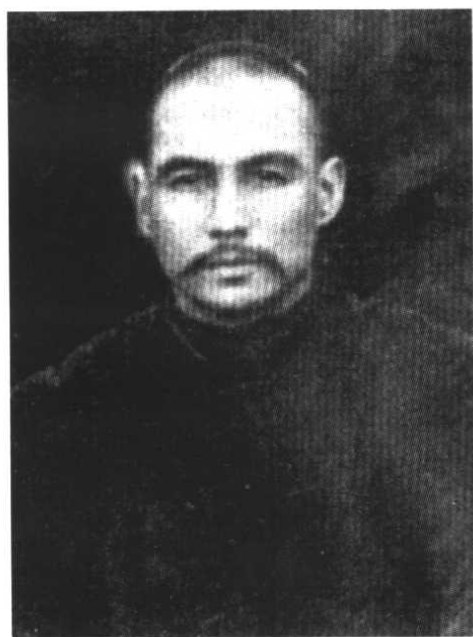
روزى تەمبۇر 30 – يىللاردا