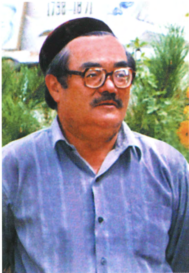
يازغۇچى زوردۇن سابىر (1937 — 1998)