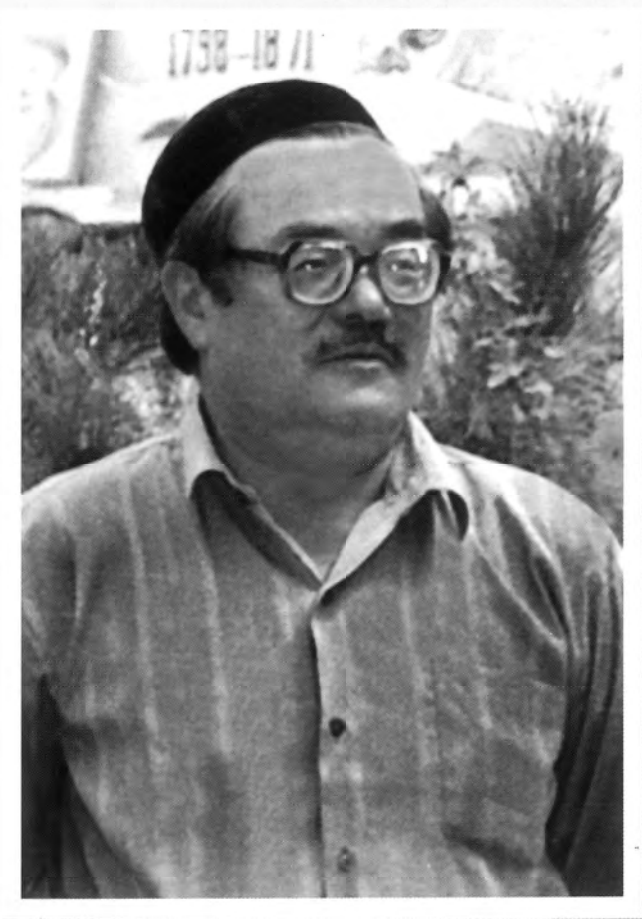
يازغۇچى زوردۇن سابىر (1937 — 1998)