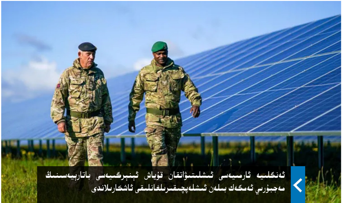
ئەنگىلىيە ئارمىيەسى ئىشلىتىۋاتقان قۇياش ئېنېرگىيەسى باتارىيەسىنىڭ مەجبۇرىي ئەمگەك بىلەن ئىشلەپچىقىرىلغانلىقى ئاشكارىلاندى

قانۇنغا بۇزغۇنچىلىق ھېسابلىنىدۇ» دېيىلگەن. ۋولكېر تۈرك بۇلتۇر 11-ئايدا ب د ت كىشىلىك ھوقۇق ئالىي كومىسسارىلىق ۋەزىپىسىگە ئولتۇرغاندىن بېرى بىرقانچە قېتىم يۇمشاق تەلەپپۈزدا «شىنجاڭنىڭ كىشىلىك ھوقۇق ۋەزىيىتى» دەپ تىلغا ئالغان بولسىمۇ، ئەمما ئۇ ئۇيغۇر تەشكىلاتلىرى ۋە كىشىلىك ھوقۇق ئورگانلىرى تەرىپىدىن ئۇيغۇر مەسلىسىدە دادىل بولماسلىق بىلەن ئەيىبلىنىپ كەلمەكتە.