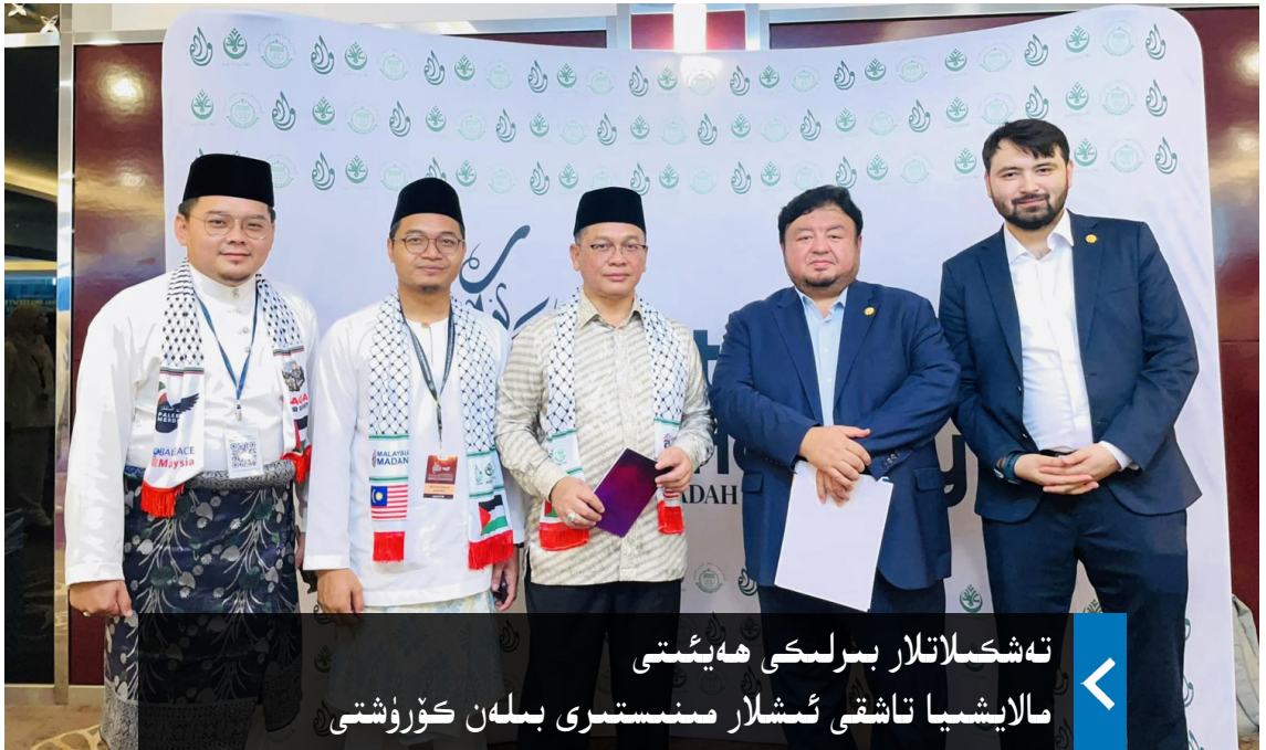
تەشكىلاتلار بىرلىكى ھەيئىتى مالايشيا تاشقى ئىشلار مىنىستىرى بىلەن كۆرۈشتى

دوكلاتتا خەلقئارادا 500 كۈچلۈك كارخانا تىزىملىكىگە كىرگۈزۈلگەن ئاتالمىش «شىنجاڭ» جوختەي گۇرۇھى ئىگىدارچىلىقىدىكى پاختا مەھسۇلاتلىرىنى پىششىقلاپ ئىشلەش زاۋۇتى تەپسىلىي تونۇشتۇرۇلغان بولۇپ، بۇ گۇرۇھ 2023-يىلى 6-ئايدىن باشلاپ ئامېرىكا يولغا قويغان «ئۇيغۇر مەجبۇرىي ئەمگەكنى چەكلەش قانۇنى»غا ئاساسەن جازالاش تىزىملىكىگە كىرگۈزۈلگەن. بۇ كارخانىنىڭ مەھسۇلاتى ئورگانىك ۋە بىرىكمە تاللىق رەخت، سۈنئىي خۇرۇم ۋە يېپىشقاق مەھسۇلاتلارنى ئۆز ئىچىگە ئالىدىكەن. بۇ دوكلاتنىڭ ئاپتورلىرىدىن بىرى بولغان