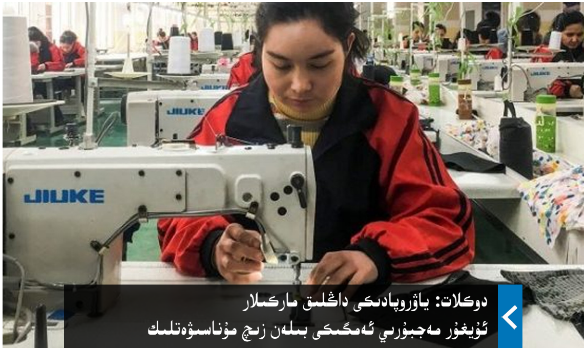
دوكلات: ياۋروپادىكى داڭلىق ماركىلار ئۇيغۇر مەجبۇرىي ئەمگىكى بىلەن زىچ مۇناسىۋەتلىك

مەلۇم بولۇشىچە، ئىلتاييەنىڭ خىتاينىڭ «بىر بەلباغ، بىر يول» تەشەببۇسىغا قاتنىشىش كېلىشىمى 2024-يىلى 3-ئايدا توشىدىكەن. ئىلتاييە ھۆكۈمىتى يېقىندا خىتايغا مەكتۇپ ئەۋەتىپ، ئىلتاييەنىڭ توختامنى ئۇزارتماسلىق ھەققىدىكى قارارىنى ئۆقتۈرغان.