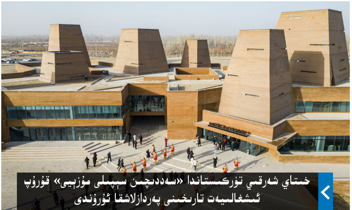
خىتاي شەرقىي تۈركىستاندا «سەددىچىن سېپىلى مۇزېيى» قۇرۇپ ئىشغالىيەت تارىخىنى پەردازلاشقا ئۇرۇندى

ئاخىرىدا شەرقىي تۈركىستان ئۆلىمالار بىرلىكى مۇئاۋىن رەئىسى ۋە تەشكىلاتلار ئارا مۇناسىۋەت مەسئۇلى ئۇستاز سىراجىدىن ئەزىزى سۆز قىلىپ، تەشكىلاتلار ئارىسىدىكى بىر قىسىم يىرىكچىلىك ۋە ئىختىلاپلارنىڭ مۇستەقىللىق دەۋاسى ۋە مۇھاجىرەتتىكى شەرقىي تۈركىستان خەلقىگە سەلبىي