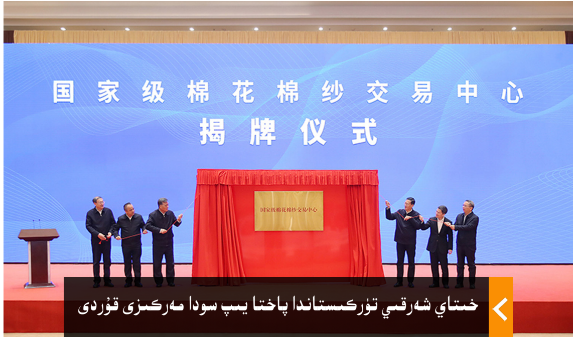
خىتاي شەرقىي تۈركىستاندا پاختا يىپ سودا مەركىزى قۇردى

قىلىپ ئەۋەتىشمۇ ئەنە شۇ رەزىل مەقسەتنىڭ بىر قىسمى سۈپىتىدە «ئۇيغۇرلارغا ئالاھىدە ئورۇن بېرىۋاتقانلىقى»نى ئىسلام ئەللىرىگە بىلدۈرۈش ئارقىلىق ئەرەب ۋە ئىسلام ئەللىرىنى ئالداش ئىكەنلىكىنى، ئەمما بۇنىڭ بىلەن