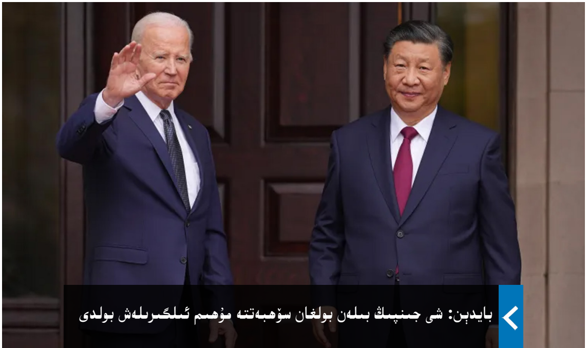
بايدېن: شى جنپىڭ بىلەن بولغان سۆھبەتتە مۇھىم ئىلگىرىلەش بولدى

ئىككى ئارمىيە ئوتتۇرىسىدىكى بىۋاسىتە ئالاقىنى ئەسلىگە كەلتۈرۈشكە قوشۇلغان. بۇنىڭ بىلەن ئىككى تەرەپ بىۋاسىتە، ئوچۇق-ئاشكارا ئالاقە قىلىشقا كېلىشكەن. ئۈچىنچى نەتىجە، ئامېرىكا ۋە خىتاي مۇتەخەسسسلرى بىر يەرگە جەم بولۇپ، سۈنئىي ئىدراكقا مۇناسىۋەتلىك نېمىنىڭ پايدىلىق، نېمىنىڭ پايدىسىز، نېمىنىڭ خەتەرلىك مەسىلە ئىكەنلىكىنى مۇزاكىرە قىلىدىكەن ۋە مۇزاكىرە نەتىجىسىدە توغرا يۆنىلىشتىكى ئەمەلىي قەدەملەرنى بەلگىلەيدىكەن.