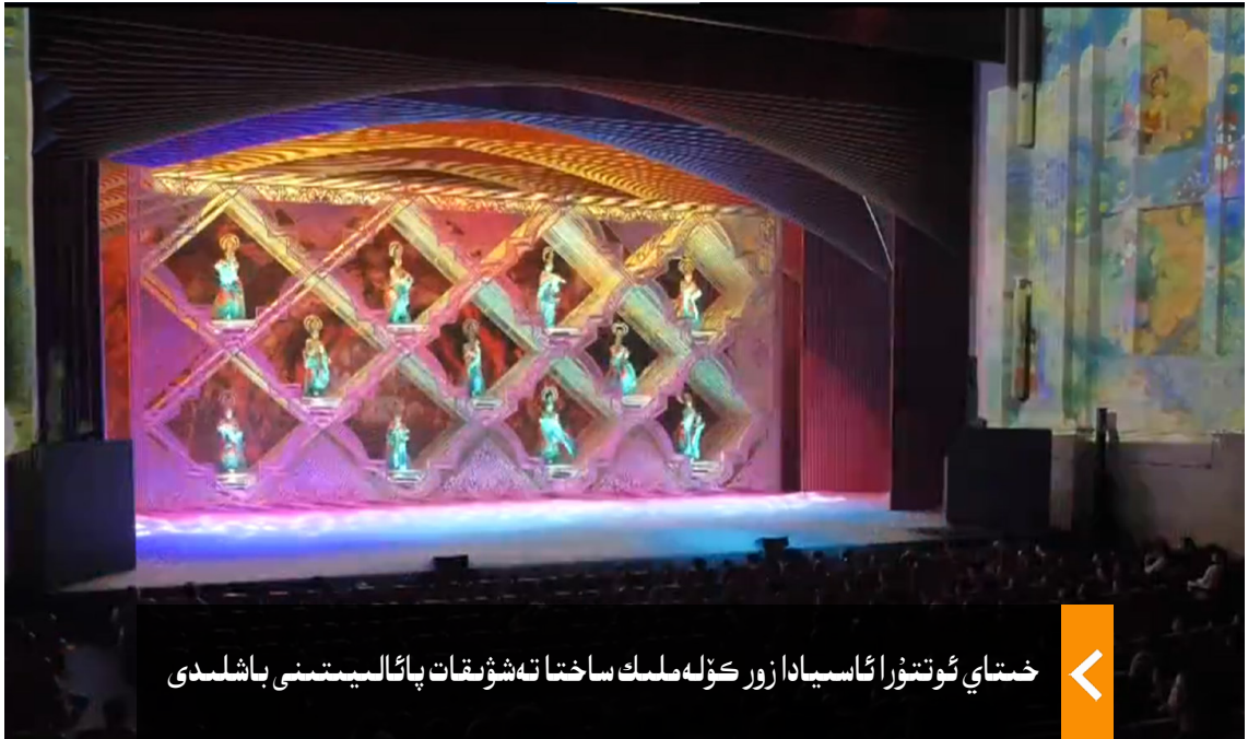
خىتاي ئوتتۇرا ئاسىيادا زور كۆلەملىك ساختا تەشۋىقات پائالىيىتىنى باشلىدى

فىلىمنىڭ رېژىسسورى داۋىد نوۋاك ئامېرىكىلىق يەھۇدىي بولۇپ، ئۇنىڭ ئائىلىسى ئىككىنچى دۇنيا ئۇرۇشى مەزگىلىدە ياۋروپادىكى چوڭ قىرغىنچىلىقنى باشتىن كەچۈرگەن. جازا لاگېرلىرى ۋە مەجبۇرىي ئەمگەك سەۋەبلىك،