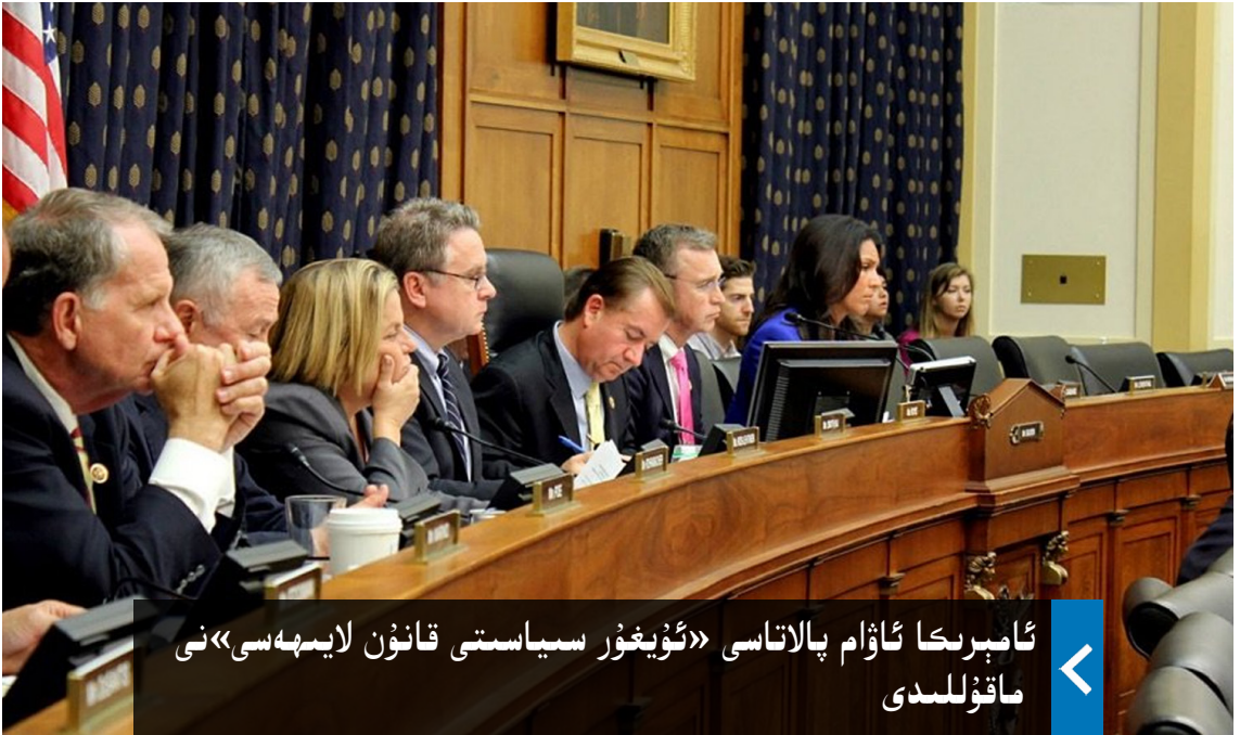
ئامېرىكا ئاۋام پالاتاسى «ئۇيغۇر سىياسىتى قانۇن لايىھەسى» نى ماقۇللىدى

سېلىشىنى توسۇش، تىبەت ۋە شەرقىي تۈركىستاننىڭ كىشىلىك ھوقۇق مەسىلىسىنى قوللاش قاتارلىقلار ئورۇن ئالغان.