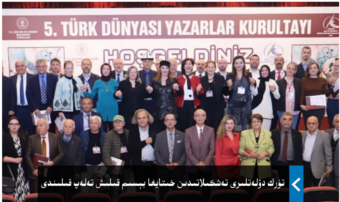
تۈرك دۆلەتلىرى تەشكىلاتىدىن خىتايغا بېسىم قىلىش تەلەپ قىلىندى

«كوئېنلوندىكى مۇھەببەت سىمفونىيەسى» دېگەندەك ئۈچ بۆلەككە بۆلۈنگەن. بۇنىڭ ئىچىدە ئۇيغۇر مۇقاملىرى، موڭغۇللارنىڭ قەھرىمانلىق ئېپوسى «جاڭخىر»، قىرغىزلارنىڭ قەھرىمانلىق ئېپوسى «ماناس»، قازاق مىللىتىنىڭ قارا جورغا ئۇسسۇلى قاتارلىقلار بار ئىكەن. خىتاي بۇ قېتىمقى يالغان تەشۋىقات پائالىيىتىدە يەنە شەرقىي تۈركىستاننىڭ ھەقىقىي ۋەزىيىتىگە پۈتۈنلەي زىت بولغان «فوتو سۈرەت كۆرگەزمىسى» ئۆتكۈزۈلۈش ئارقىلىق، قازاقىستان ۋە ئۆزبېكىستان خەلقىنىڭ كۆزىنى بويماقچى بولغان.