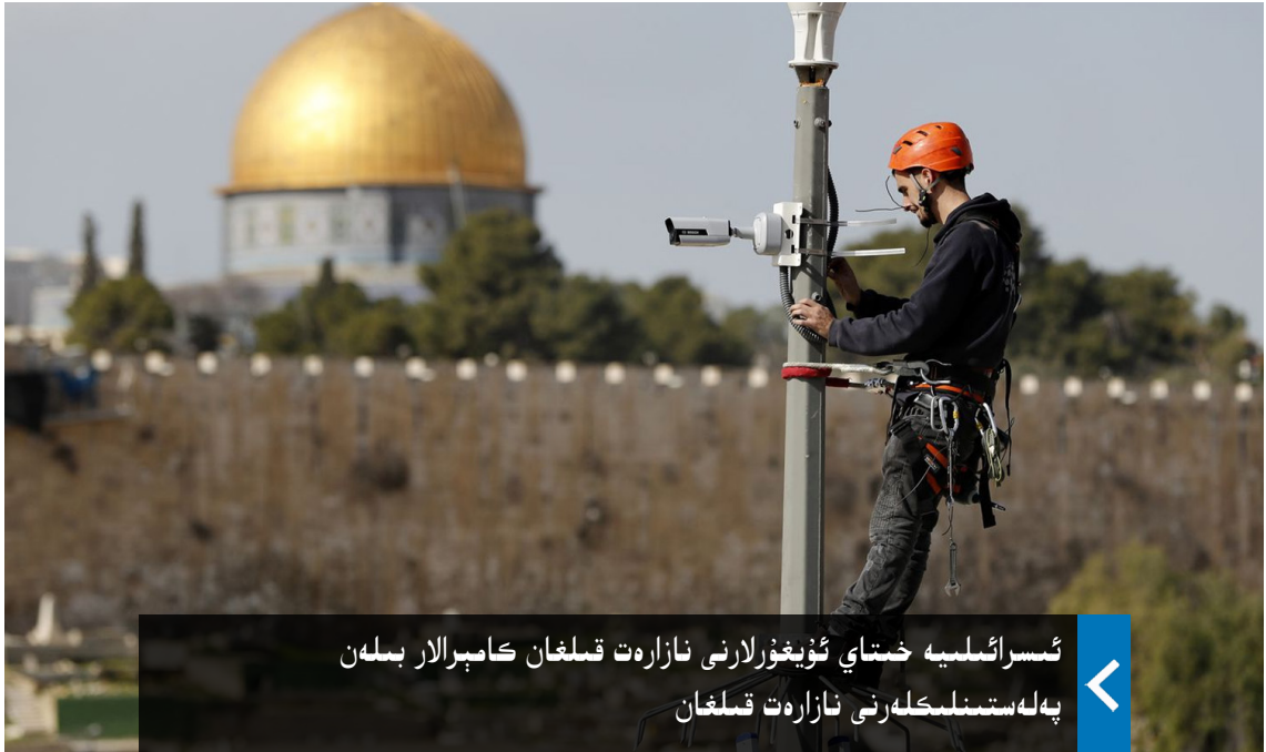
ئىسرائىلىيە خىتاي ئۇيغۇرلارنى نازارەت قىلغان كامېرالار بىلەن پەلەستىنلىكلەرنى نازارەت قىلغان

ئۇيغۇر قۇرۇلتىيى، شەرقىي تۈركىستان فېدېراتسىيەسى، دۇنيا ئۇيغۇر قۇرۇلتىيى ۋەقى، شەرقىي تۈركىستان ۋەقى، دۇنيا ئۇيغۇر يازغۇچىلار ئۇيۇشمىسى، ئۇيغۇر ئىلىم- مەرىپەت ۋەقى، ئۇيغۇر تەتقىقات مەركىزى ۋە ئۇيغۇر ھەرىكىتى تەشكىلاتى قاتارلىق تەشكىلاتلار بىرلىكتە ئىستانبۇلنىڭ زەيتىنبۇرۇن رايونىدا ئىككى جۇمھۇرىيەتنى خاتىرىلەش پائالىيىتى ئۆتكۈزدى.