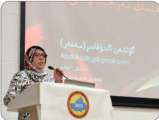
مۇتەللىپ «ئىستانبۇلدا 20 لېكسىيە 2023» ئىلمىي مۇھاكىمە يىغىنىدا لېكسىيە سۆزلىمەكتە