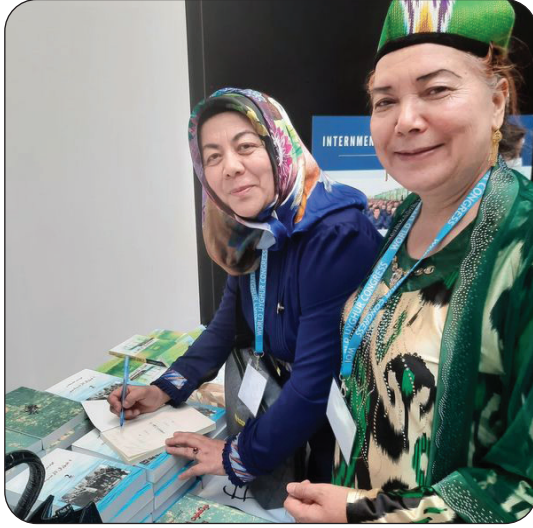
مۇئەللىپ پىراگادا ئىمزالىق كىتاب تونۇشتۇرۇش پائالىيىتىدە