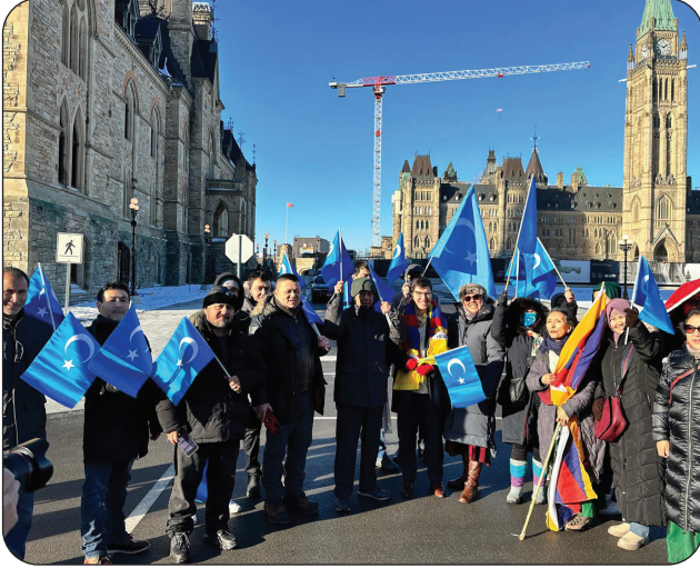
مۇئەللىپ كانادا پارلامېنت ئەزالىرى بىلەن بىرگە ئوتتوۋا شەھىرىدىكى نامائىش مەيدانلىرىدا