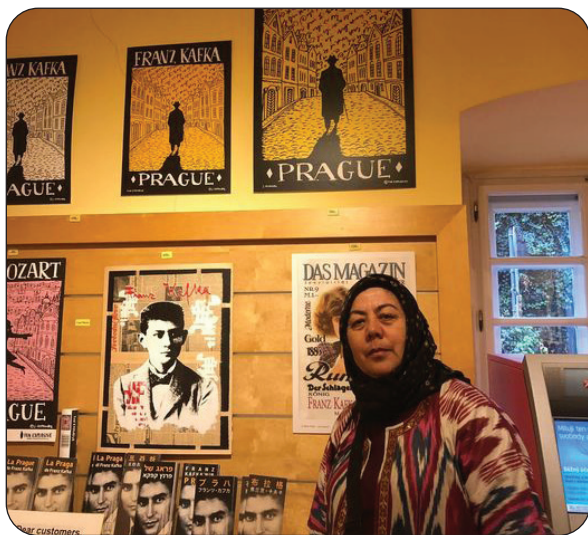
مۇئەللىپ پىراگا شەھىرىدىكى فىرانز كافكا مۇزېيىدا