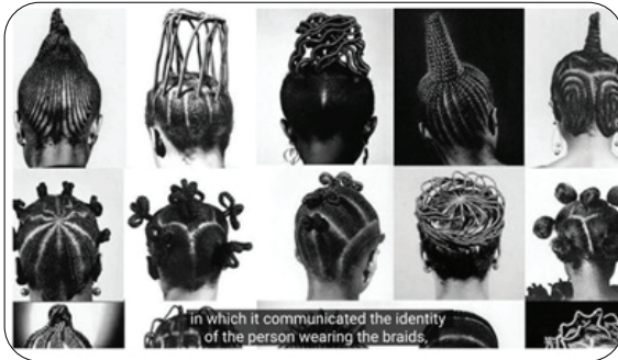
چاچقا يېزىلغان زۇلۇم داستانلىرى