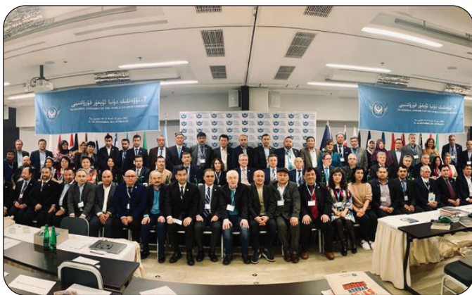
دۇ ق 7- نۆۋەتلىك ۋەكىللەر قۇرۇلتىيى خاتىرە رەسىمى