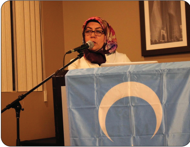
مۇتەللىپ كانادانىڭ تورونتو شەھىرىدە «5-فېۋرال» غۇلجا ئىنقىلابى ھەققىدە لېكسىيە سۆزلىمەكتە