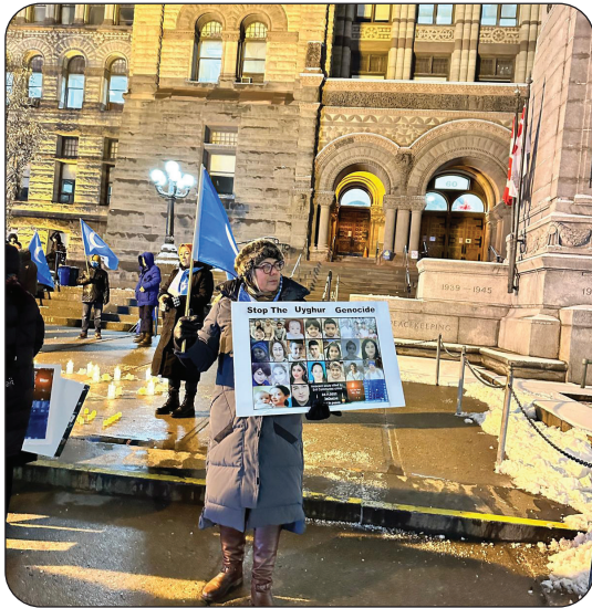
مۇئەللىپ تورونتو شەھىرىدىكى نامائىش مەيدانلىرىدا