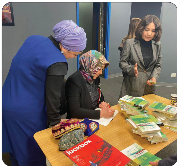
مۇئەللىپ ۋاشىنگتون شەھىرىدە ئۆتكۈزۈلگەن پائالىيەتتە «5-فېۋرال ئارخىپىلىرى (1)» كىتابىنى ئىمزالىق تارقىتىشقا