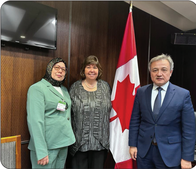
مۇئەللىپ كانادا پارلامېنت ئەزاسى ئانىتا خانىم ۋە دۇنيا ئۇيغۇر قۇرۇلتىيى رەئىسى دولقۇن ئەيسا بىلەن بىللە