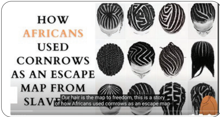
چاچقا ئۆرنىمىسىدىكى قېچىش خەرىتىلىرى