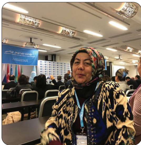
مۇئەللىپ دۇ ق 7- نۆۋەتلىك ۋەكىللەر قۇرۇلتىيىدا