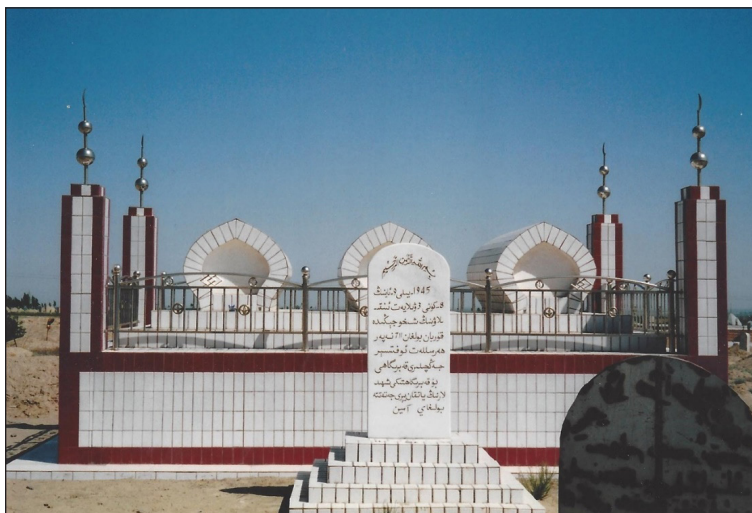
قارا سۇ (شخۇ) ئۇرۇشى قەھرىمانلىرىمىزنىڭ قەبرىسى.

ئېنىقلىشىمچە: قەبرىگاھنىڭ لايىھەسىنىمۇ سابىق كومىسسار مەھتىمىن ئۆمەرۇپ ئۆزى لايىھەلىگەن. يەنى: قەبرىگاھنىڭ ئاستىغا ئۈچ پەلەمپەيلىك سۇيا چىقىرىلغان بولۇپ، ئازات ئۈچ ۋىلايەتكە سىمۋول قىلىنغانىدى؛ سۇيا ئۈستىگە ئۈچ گۈمبەز قاتۇرۇلغان بولۇپ، ئۈچ ۋىلايەتنى ئازات قىلغاندىن كېيىن داۋاملىق شىخۇ سوقۇشىغا قاتنىشىپ قۇربان بولغان كاماندىر-جەڭچىلەرگە سىمۋول قىلىنغان. گۈمبەزلەرنىڭ ھەربىرىنىڭ ئۇزۇنلىغى 237 سانتېمېتىر بولۇپ، 3 گۈمبەزنىڭ ئومۇمىي ئۇزۇنلۇقىنى قوشقاندا 711، يەنى، بۇ يەرگە مۇشۇنچىۋالا كۆپ باتۇرلار كۆمۈلگەن، دېگەن مەنا چىقىدۇ.