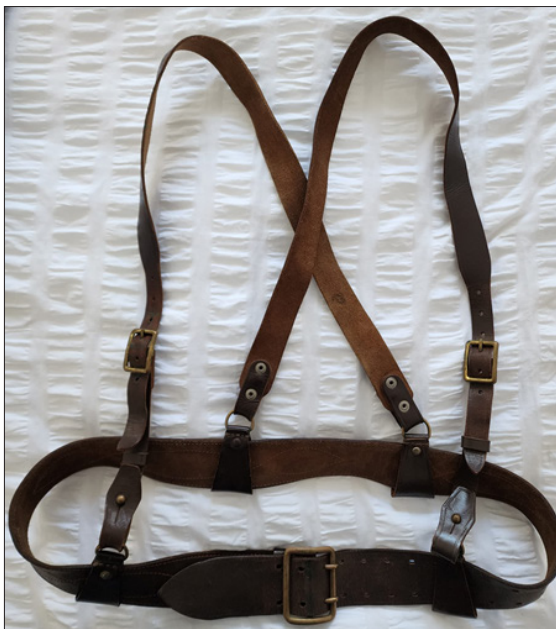
شەرقىي تۈركىستان جۇمھۇرىيىتى «مىللىي ئارمىيە» جەڭچىلىرى ئىشلەتكەن ھەربىيچە بەلباغ.