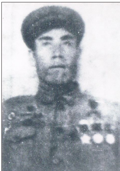
(1924 — 1962) نادىروپ زىخىرۇللام