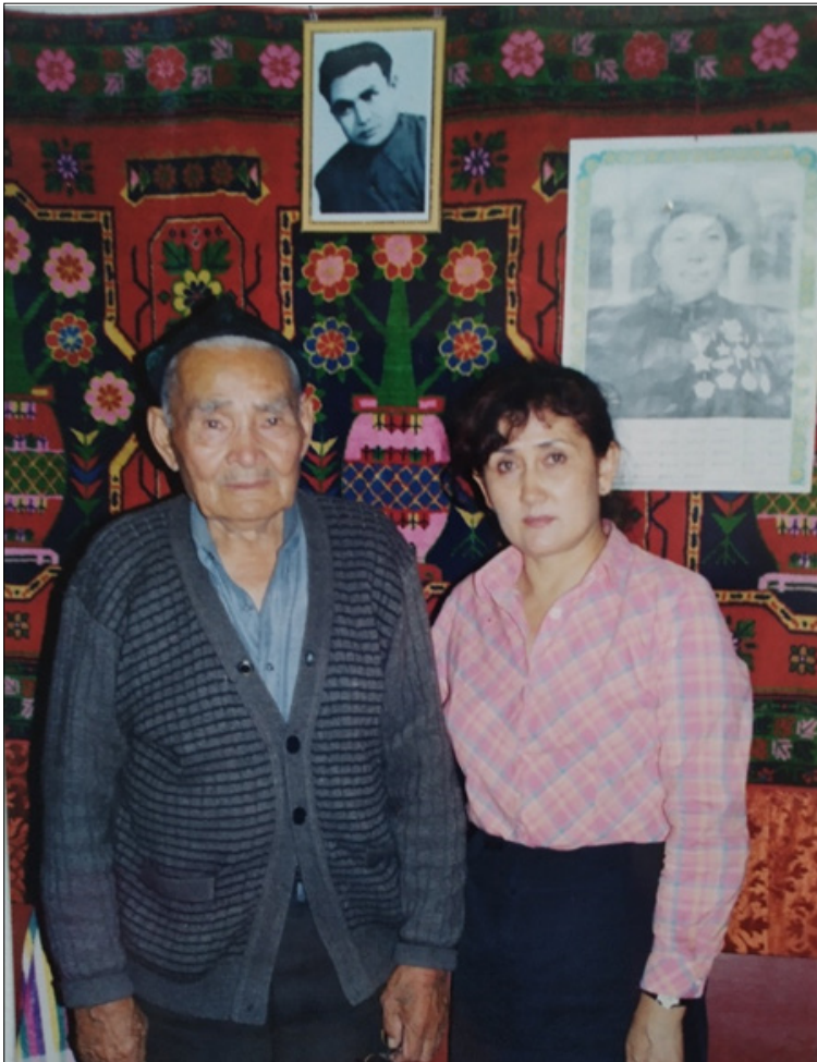
ئاپتوننىڭ قەھرىمانى تۇنجى قېتىم زىيارەت قىلغان كۈنىدىن خاتىرە.

چىقىپ تۇرغان، ئاق ۋە كەڭ چاسا يۈزلۈك، توم قارا قاشلىق باتۇرىمىز ئورنىدىن تۇرۇپ كۈتۈۋالدى. باشتا سەل خۇدۇكسېرىگەندەك قىلدى. توغرا چۈشىنىشكە بولاتتى. چۈنكى، ئۆمۈر بويى پايلاقچىلارنىڭ نازارىتىدە ياشاش ئىنساندا گۇمانخورلۇق پىسخىكىسى پەيدا قىلىدۇ-دە! (2)