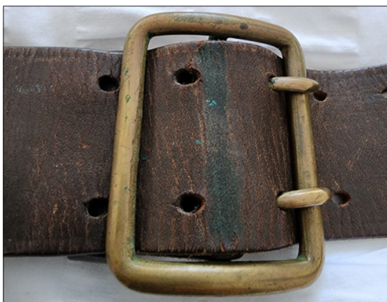
ھەربىيچە بەلباغنىڭ يېقىندىن كۆرۈنۈشى.