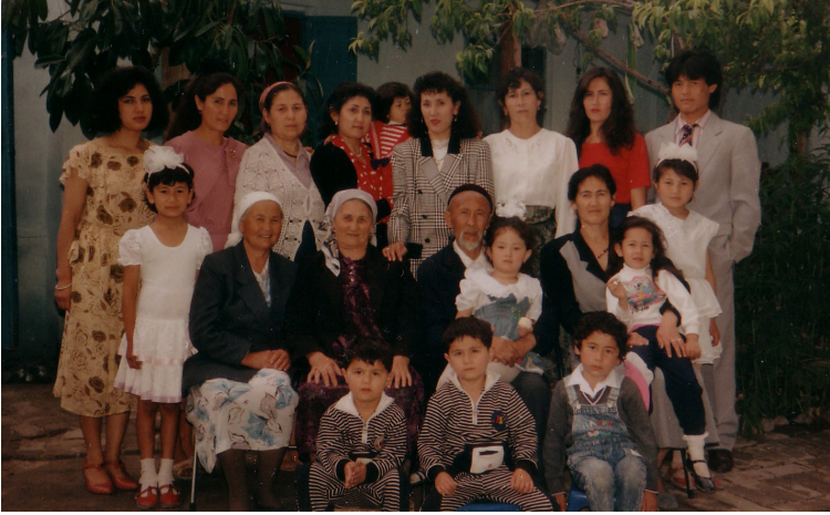
دادام بىلەن ئاپام قىزلىرى، نەۋرىلىرىنىڭ بىرقىسمى ۋە زۇبەيدە ئاپپاي بىلەن.