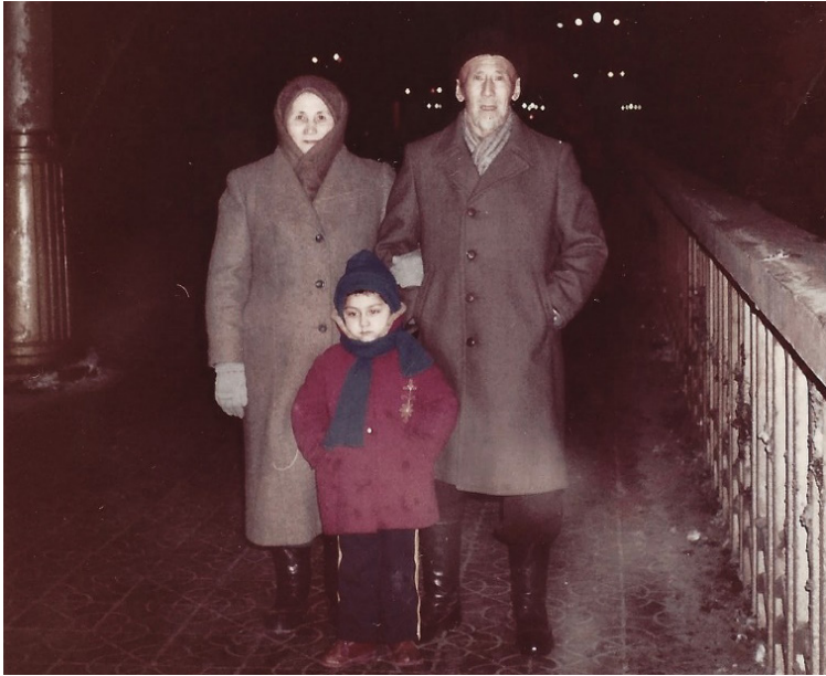
دادام بىلەن ئاپام ئوغلۇم مالىك بىلەن ئۈرۈمچىدە.