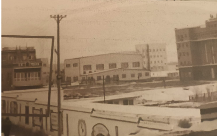
مەسچىتلەر ھاجەتخانىغا، بىنالار جازا لاگېرىغا ئايلىنىدۇرۇلماقتا