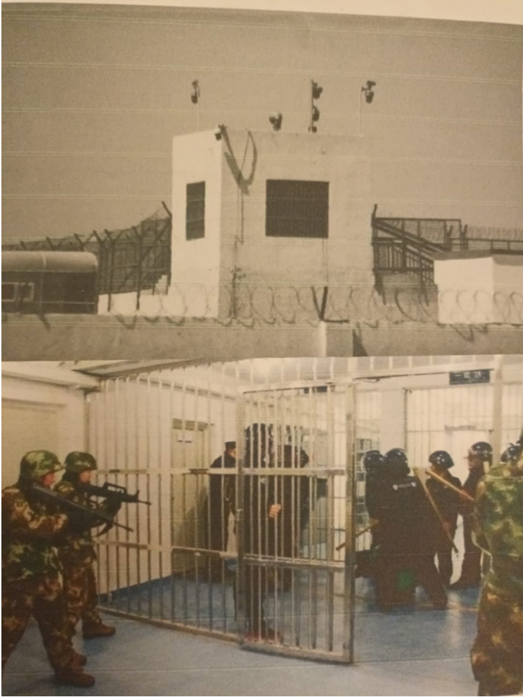
جازا لاگېرلىرىنىڭ تاشقى ۋە ئىچكى كۆرۈنىشى