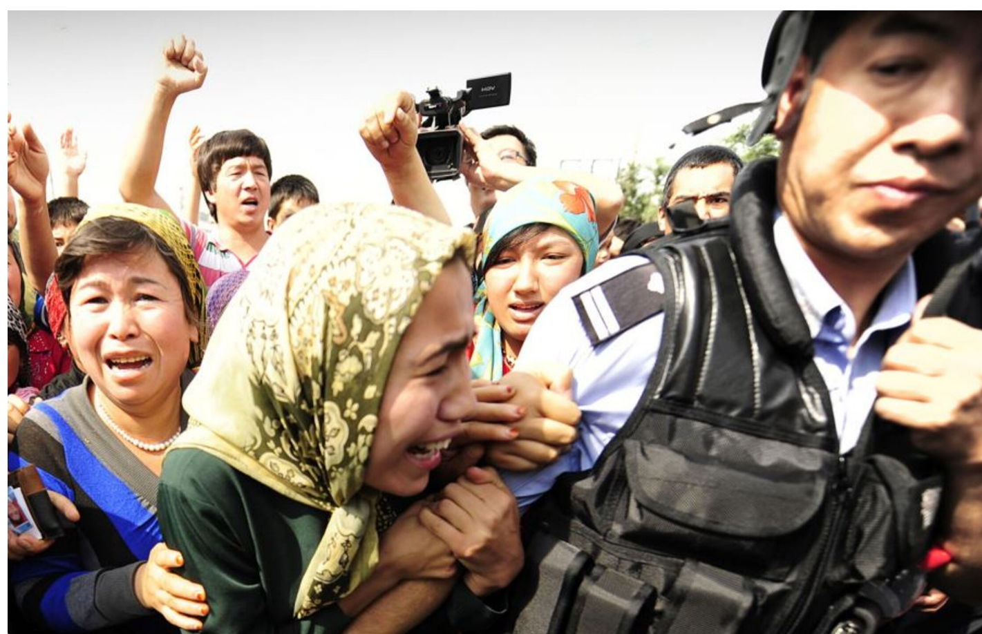
نامايىش جەريانىدا ساقچىلار بىلەن تۇتۇشقان ئۇيغۇر ئاياللار