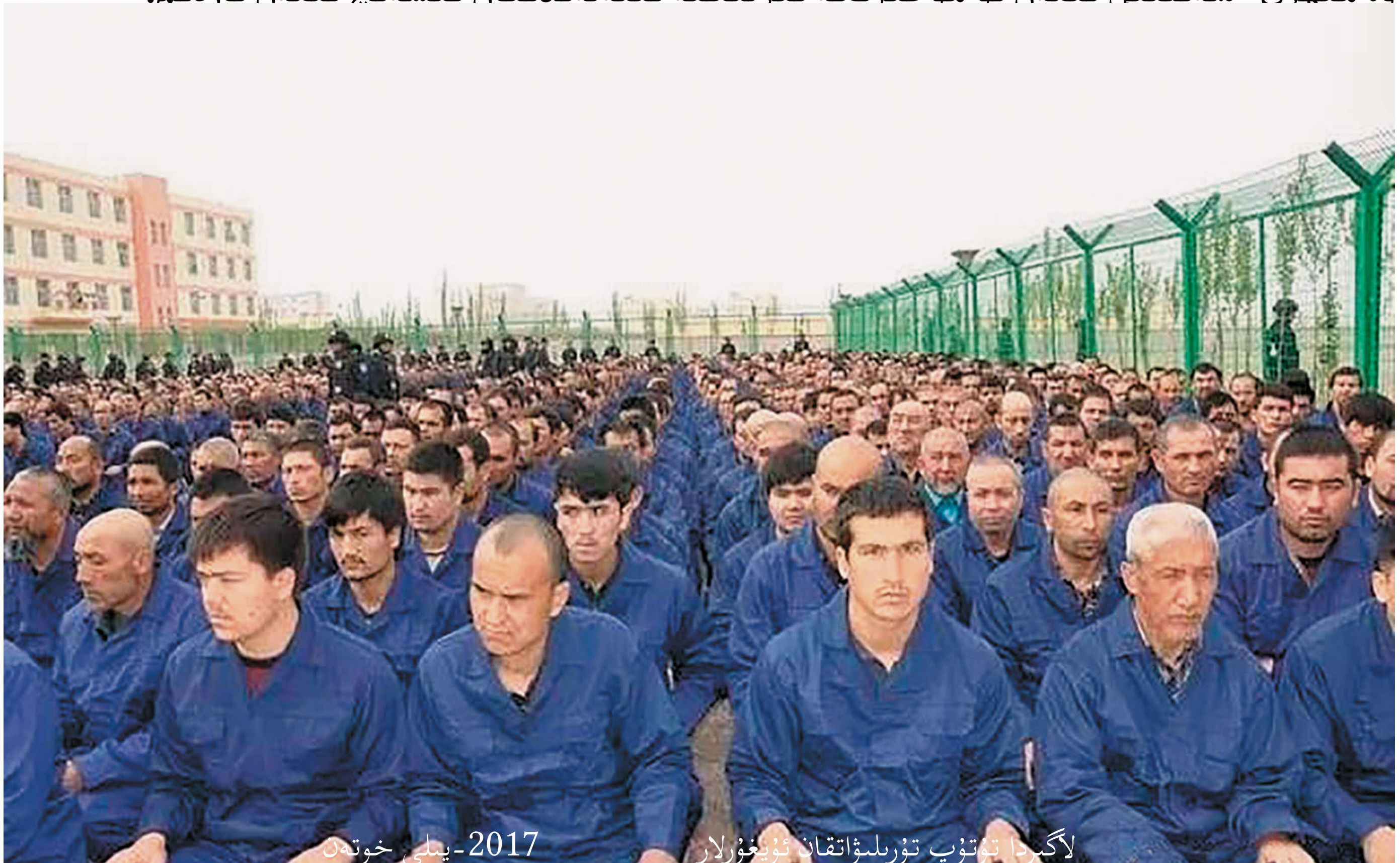
لاگېردا تۇتۇپ تۇرىلىۋاتقان ئۇيغۇرلار 2017-يىلى خوتەن