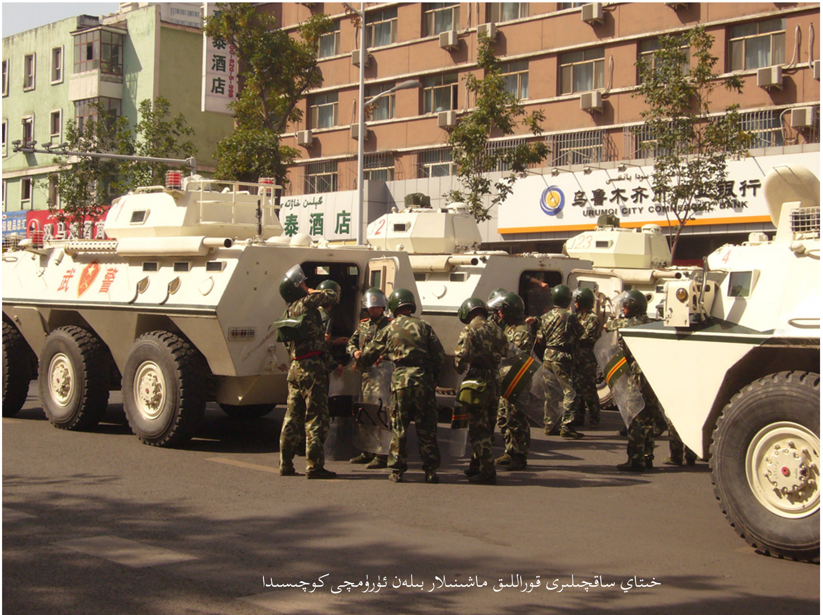
خىتاي ساقچىلىرى قوراللىق ماشىنىلار بىلەن ئۈرۈمچى كوچىسىدا

ئەپسۇس، 2018-يىلىنىڭ بېشىدا خەۋەر كۆرۈۋاتقېنىمدا ، "21-ئەسىردىكى چوڭ قىرغىنچىلىق "دېگەن كىشىنى پاراكەندە قىلىدىغان بىر تېما دىققىتىمىنى تارتتى. ئۇلانمىنى ئېچىپ، خىتاينىڭ 2 مىليوندىن ئارتۇق بىگۇناھ ئۇيغۇر خەلقىنى جازا لاگېرلىرىغا سولغانلىقى ۋە ئۇيغۇرلارنىڭ خىتاي ھۆكۈمىتى تەرىپىدىن قاتتىق قىيىن-قىستاققا ئېلىنغانلىقى توغرىسىدىكى بىر خەۋەرنى ئوقۇدۇم. دەسلەپتە بۇ خەۋەرنى خاتا بولۇپ قالدۇمكەن، دەپ ئويلىغان ئىدىم . خىتايدەك چوڭ بىر دۆلەتنىڭ پۈتۈن بىر ئاز سانلىق مىللەتنى يوقىتىۋېتىشتەك بىر ئىشقا ئارىلىشىپ قېلىشىنى ئويلىغۇم كەلمەيتتى. چۈنكى، مەن دۇنيانى 20-ئەسىردىكى چوڭ قىرغىنچىلىقتىن تەجرىبە-ساۋاق ئېلىپ، تارىخنىڭ قايتا تەكرارلىنىشىغا يول قويمايدۇ، دەپ ئويلايتتىم. شۇڭا، بۇ خەۋەرنى كۆرگەندىن كېيىن مۇنداقلا ئوقۇپ تاشلاپ قويغۇم كەلمەي، ئۇيغۇرلار توغرىلىق ئازراق ئىزدىنىپ، بۇ ئىشنىڭ ھەقىقىي ماھىيىتىنى تېپىپ چىقىش قارارىغا كەلدىم. بۇ دەملەردە، مەن ئالدىنقى قىرغىنچىلىقتا ئۆلتۈرۈلگەن يەھۇدىيلارنىڭ "بۇنداق ئىشنىڭ يەنە قايتا يۈز بېرىشىگە يول قويماڭلار!" دەپ ماڭا نىدا قىلغان ئاۋازلىرىنى ئاڭلىغاندەك ۋە چىرايلىرىنى كۆرگەندەك بولدۇم.