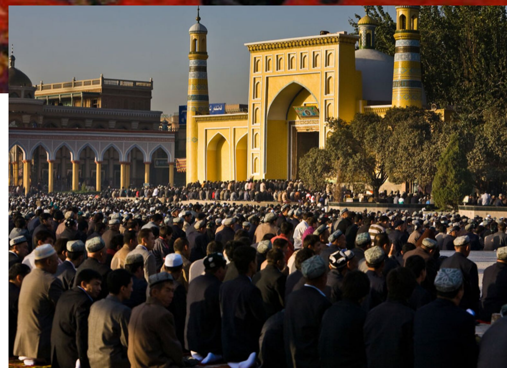
قەشقەردىكى ھېيتگاھ مەسچىدى