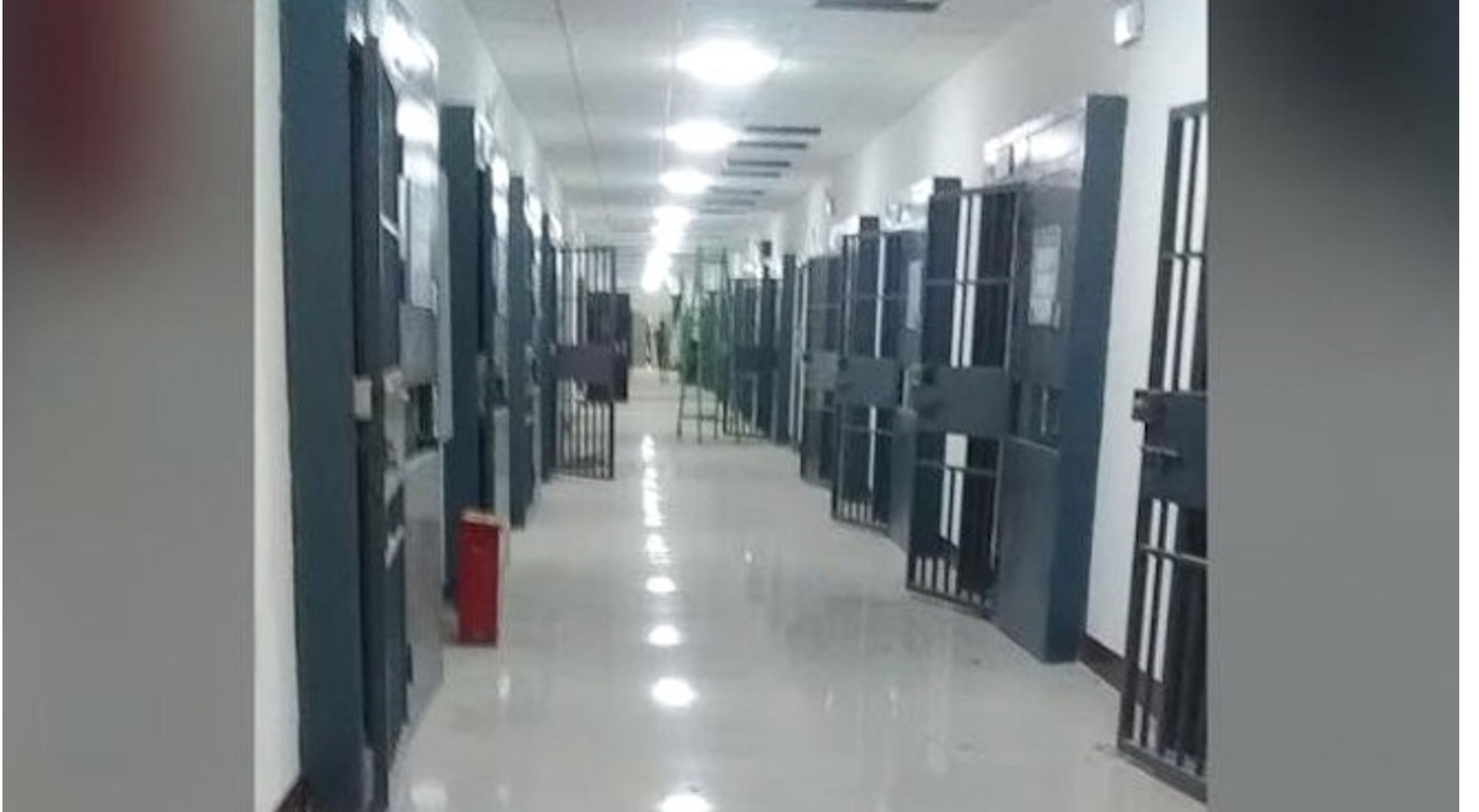
2-رەسىم: ختايلارنىڭ ئاتالمىش شىنجاڭ رايونىدىكى يېڭىدىن سېلىنغان 'قايتا تەربىيەلەش' لاگېرلىرى