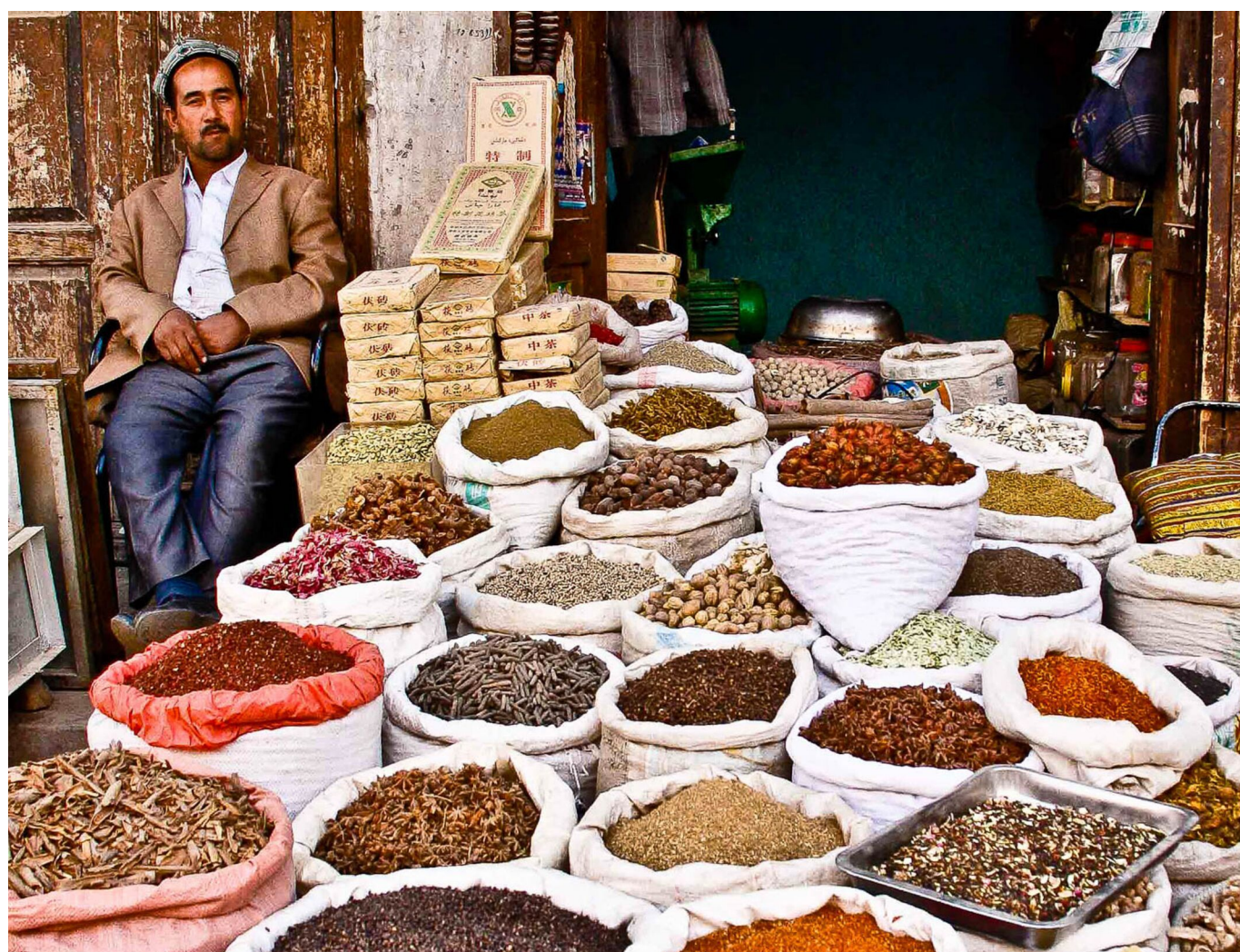
قەشقەر بازىرىدىكى دورا دەرەمەكلەر