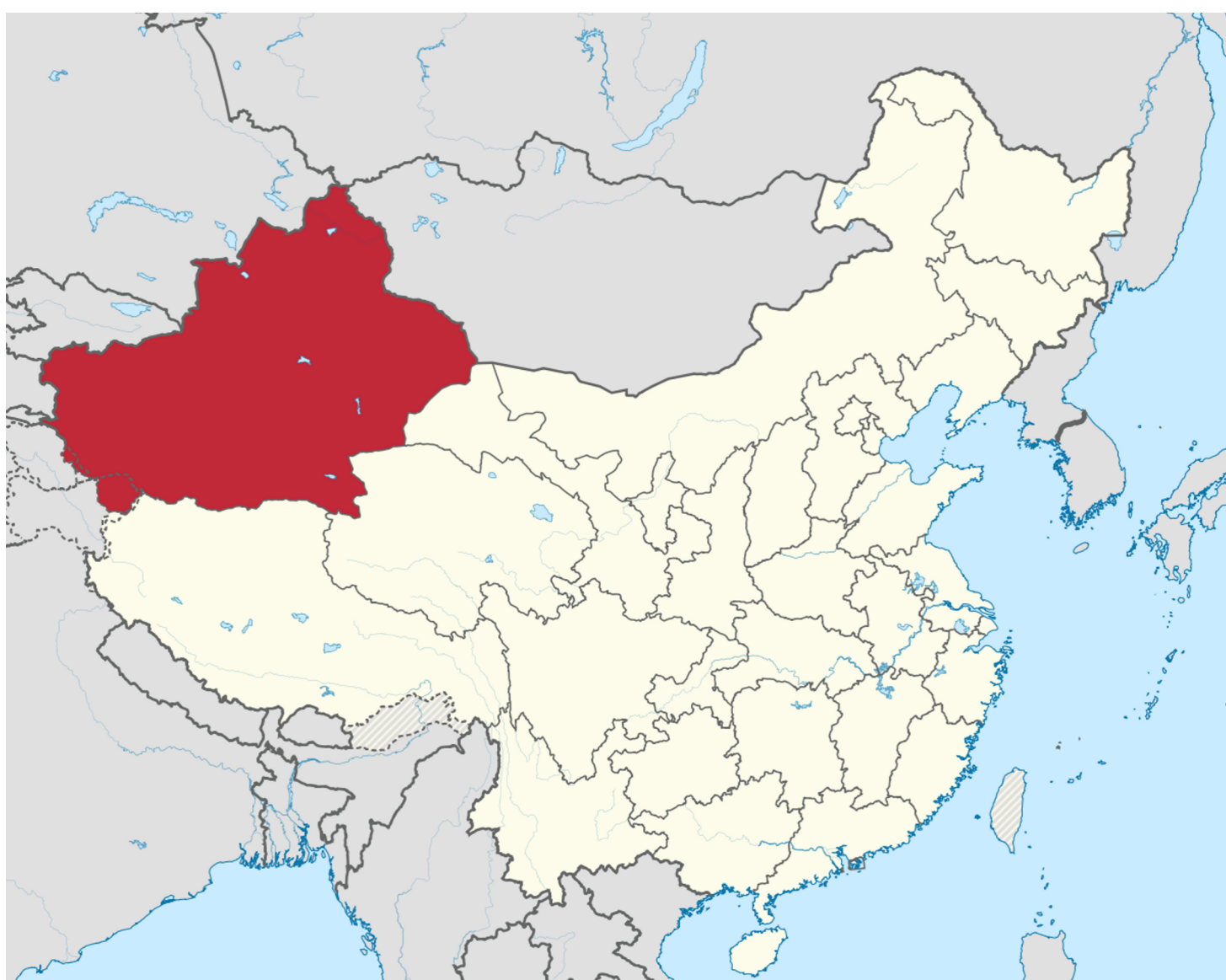
قىزىل رەڭدىكىسى ئاتالمىش شىنجاڭ ئۇيغۇر ئاپتونوم رايونى