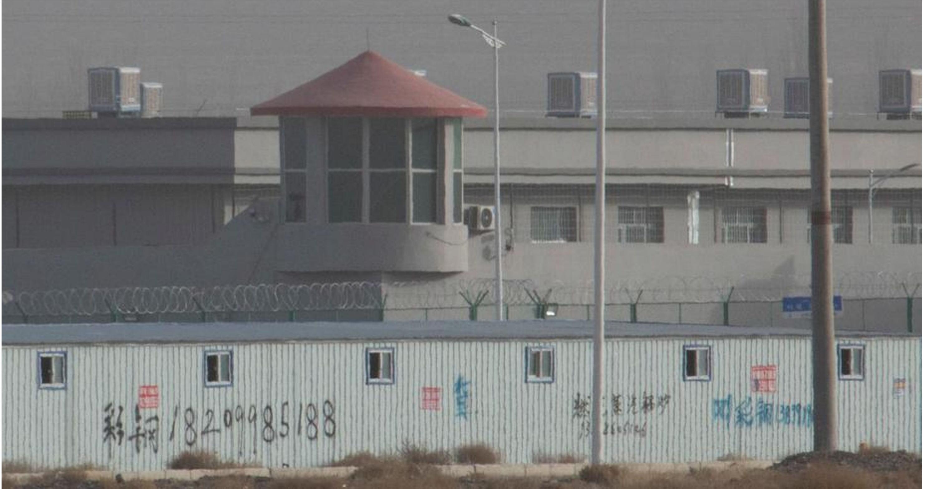
1-رەسىم: ختايلارنىڭ ئاتالمىش شىنجاڭ رايونىدىكى جازا لاگېرى