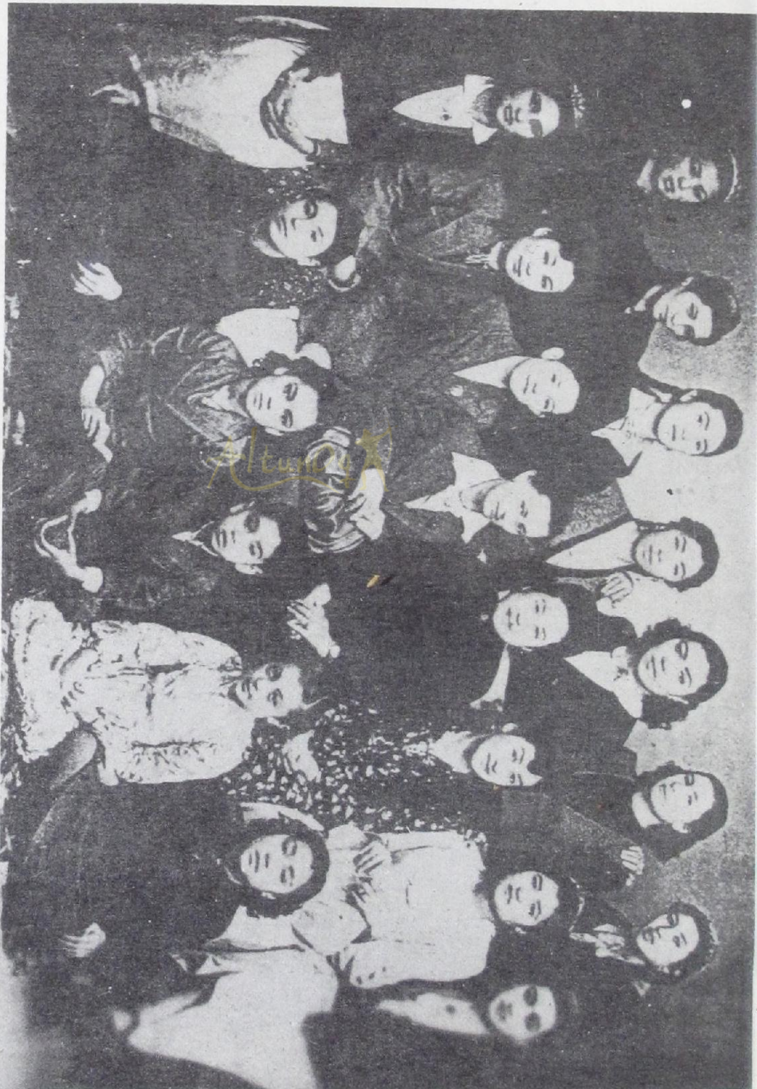
1948 - يىملى دىمچىكىرى دىۋالارىگە ئىپۋە تىلگەن تۇنجى شىنجاڭ مىللىي سەنئەت ئۆمىكى