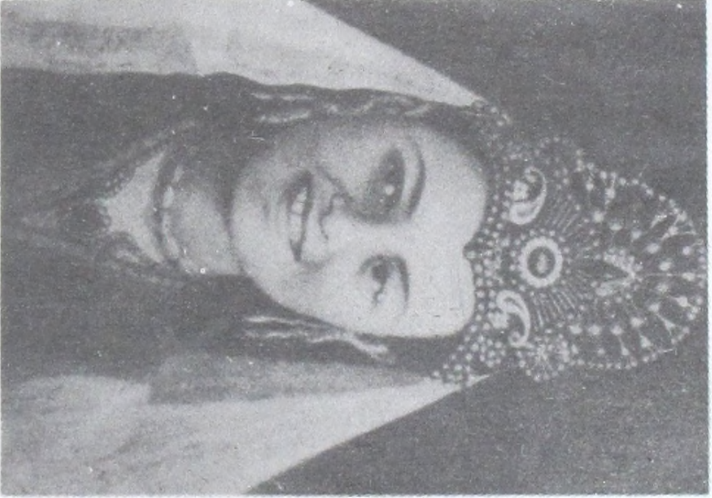
پدر بده خانم