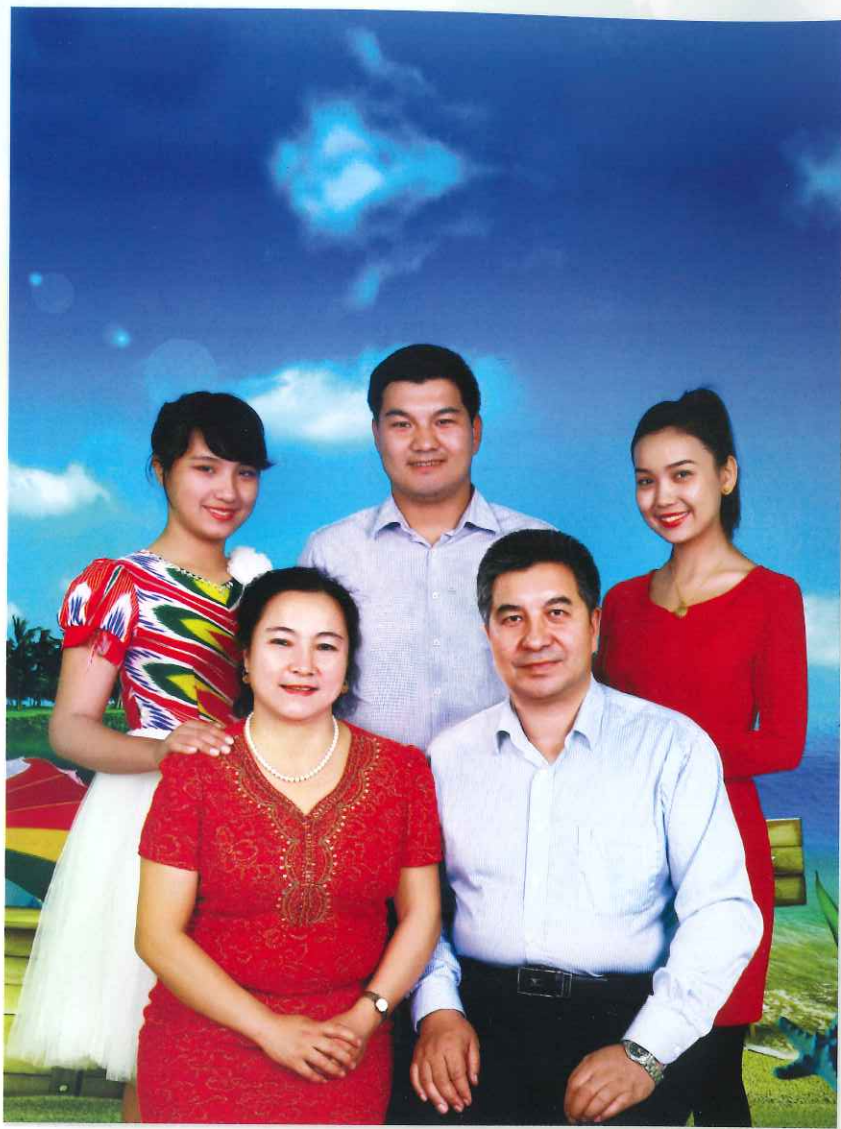
ئاپتور ئائىلىسىدىكىلەر بىلەن بىللە