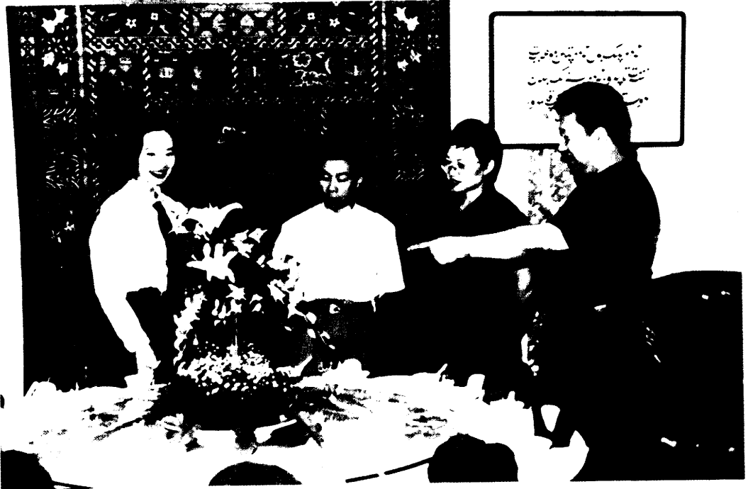
ساراي دىرىكتورلىرى كېڭەشمەكتە