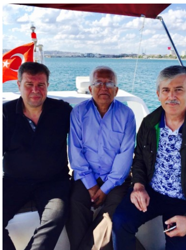
سىدىقھاجى روزى ئىستانبۇل ساھىلىدا