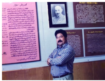
دوختۇر ئابدۇرېھىمجان ئەخمەتجان قاسىمى قەبرىسى ئالدىدا